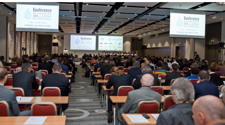
Záběry konference v Brně v roce 2018